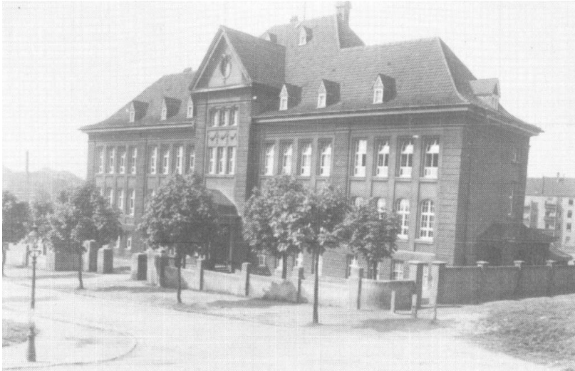
Die Rombergschule 1934

Die Recklinghäuser Zeitung schrieb dazu: