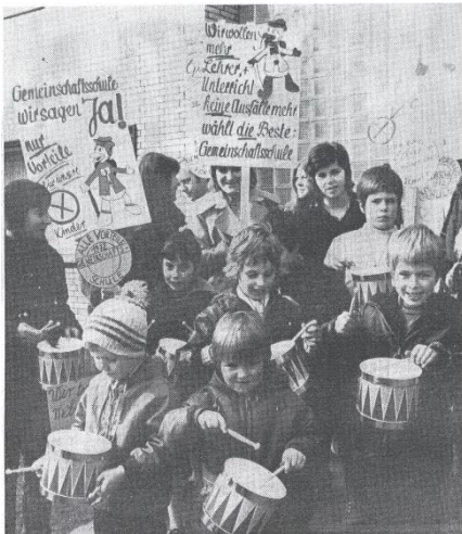
1972: Die Rombergschüler fordern eine Gemeinschaftsschule

Im Zuge einer grundlegenden Diskussion im Lande über die Zusammenlegung konfessionell getrennter Schulen Anfang der 70er Jahre findet auch im Romberg 1972 eine Befragung statt, und 75% aller katholischen sowie 94% der evangelischen Eltern wünschen sich die Umwandlung der beiden Schulsysteme in eine Gemeinschaftsgrundschule.