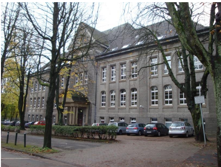
Die Rombergschule im Jahre 2014

Die Grundschule im Romberg – Speckhorn hat die Aufgabe, in der guten Tradition dieser Schule diesen Weg zu begleiten. Gerade auch im Zusammenhang mit der inklusiven Schulentwicklung übernimmt die Grundschule Im Romberg – Speckhorn gerne und selbstbewusst ihren Anteil am gesellschaftlichen und politischen Auftrag.