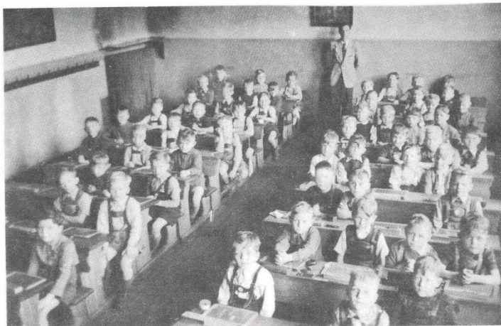
Unterricht mit mehr als 60 Schülern in der Klasse

Bis zur Errichtung eines eigenen Schulgebäudes wurde die provisorische Unterbringung in der gerade fertiggestellten Rombergschule beschlossen, und die Nordviertelschüler mussten weiterhin die Schulen der Altstadt besuchen. Aus dem Provisorium wurden sieben Jahre. 1923 wirkte sich die große Politik auch auf Recklinghausen aus: Franzosen marschierten ins Ruhrgebiet ein und beschlagnahmten in Recklinghausen zur Truppenunterbringung unter anderem die Friedhofschule am Kurfürstenwall. Die „höheren Töchter“ zogen aus, 13 Klassen der Friedhofschule sowie 4 Klassen der katholischen Hilfsschule zogen ein und wurden 1925 noch ergänzt um evangelische Klassen, deren Schüler an der Hohenzollernschule keinen Platz mehr fanden. Dieses Sammelsurium aus drei Schulsystemen mit fast 1000 Schülern blieb so fast 10 Jahre lang bestehen. Der Unterricht wurde in abwechselnden Vormittags- und Nachmittagsschichten erteilt.