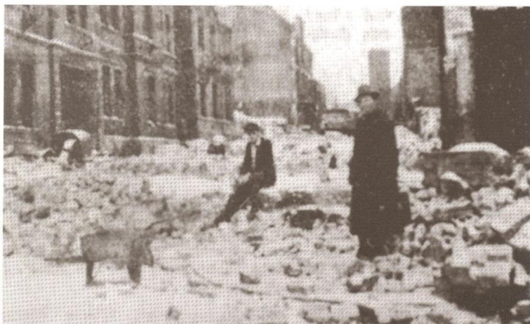
Das Nordviertel nach dem Bombenangriff vom 23. März 1945

Beim Luftangriff auf das Nordviertel wird die Schule nur leicht beschädigt. Im April und Mai 1945 dient sie als Quartier für amerikanische Soldaten. Offensichtlich hinterlassen diese ein wahres Schlachtfeld, denn die Chronik weist für die nachfolgenden 6 Wochen ein kollektives Reinemachen und Instandsetzen der Schule aus.