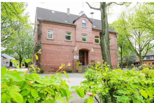
Die Don-Bosco-Schule in Speckhorn

Ein vorläufig letzter Meilenstein in der langjährigen Geschichte unserer Schule ist dann 2012 die Umwandlung der GGS Im Romberg gemeinsam mit der katholischen Don-Bosco-Schule in Speckhorn zur „Grundschule Im Romberg – Speckhorn – Gemeinschaftsgrundschule mit katholischem Bekenntnisstandort Don Bosco“.