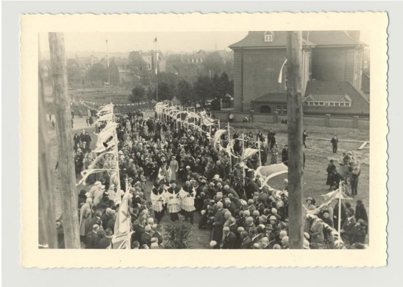
Prozession, vermutlich 1934